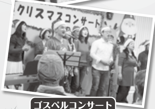
ゴスペルコンサート