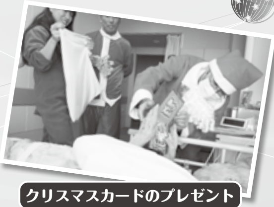
クリスマスカードのプレゼント